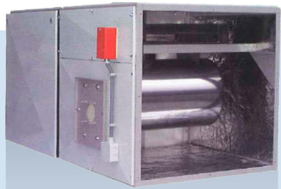
De UHR is leverbaar in horizontale en verticale uitvoering

Door verbranding van brandstof in de brander wordt de chromstalen verbrandingskamer verhit. De HE-ventilator verplaatst de luchtstroom langs deze verbrandingskamer, waardoor de lucht wordt verwarmd. Hierna verdeelt een luchtdistributiesysteem de lucht in de ruimte. Voor de meer standaard toepassingen van de UHR - bijvoorbeeld bij directe opstelling in een ruimte - kunnen wij u een meerszijdig uitblazend luchtdistributieplenum aanbieden.