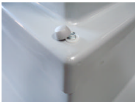
fig.2 montageplek TVC