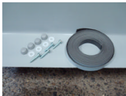
fig.3 meegeleverd bevestigingsmateriaal